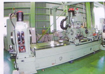
●スプライン加工機2号機

私たちは、お客様のニーズに合わせたオリジナル商品の開発も手掛けています。「こんな機械が欲しいな」と思ったら、まずはこちらへご相談下さい。納得する機械を提供し、感動のプレゼントができる様、日々努力を重ねております。