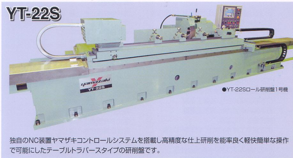
●YT-22Sロール研削盤1号機

独自のNC装置ヤマザキコントロールシステムを搭載し高精度な仕上研削を能率良く軽快簡単な操作で可能にしたテーブルトラバースタイプの研削盤です。