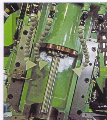
●スプライン加工機スピンドル部