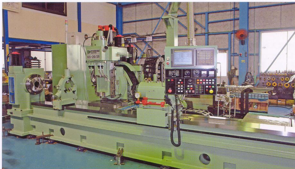
●スプライン加工機1号機