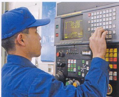
●マシニングセンター作業中