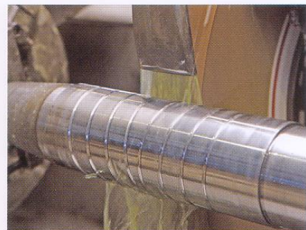
●ロール研削盤(研削中)