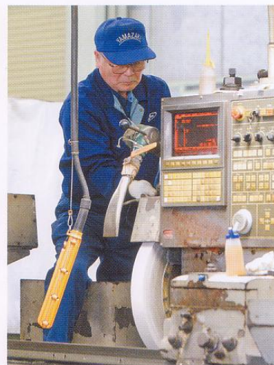
●ロール研削盤作業風景