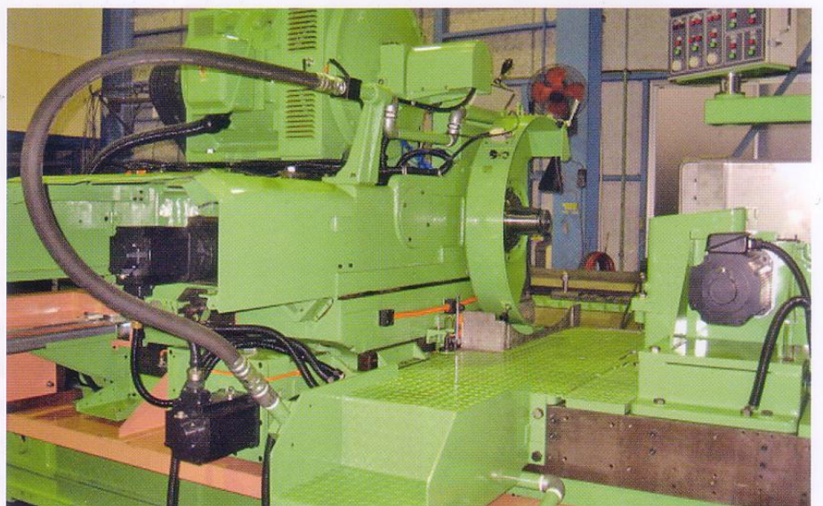
●レトロフィット大型ロール研削盤